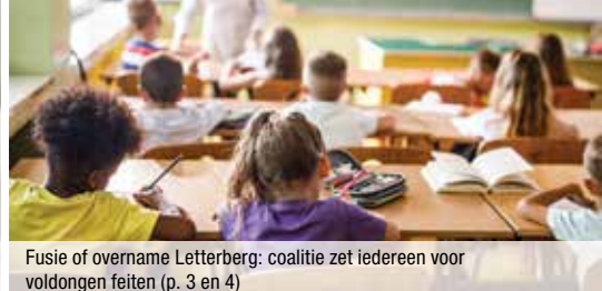
Fusie of overname Letterberg: coalitie zet iedereen voor voldongen feiten (p. 3 en 4)