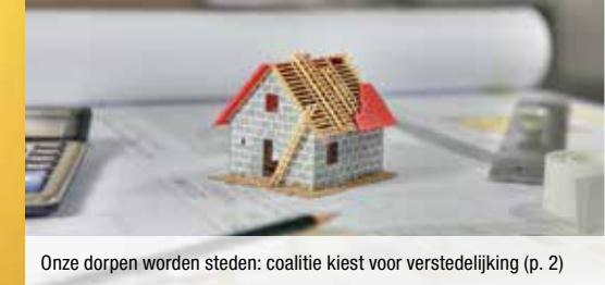
Onze dorpen worden steden: coalitie kiest voor verstedelijking (p. 2)