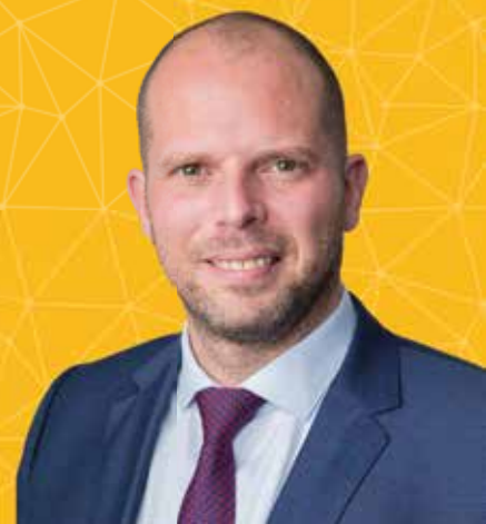
Theo Francken Kamerlid

“De N-VA blijft kiezen voor een betaalbaar, betrouwbaar en duurzaam energiebeleid. Dat maakt ons onafhankelijk van schurkenregimes. ”